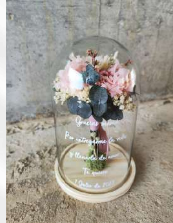
Cúpula réplica ramo de novia