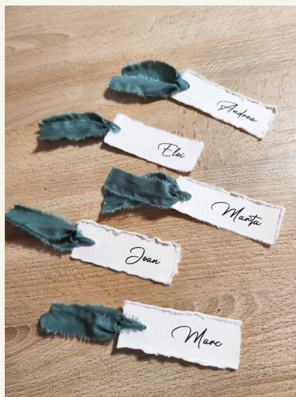
Marcasitos papel con cinta: 1,70€/unidad