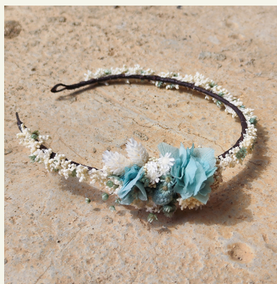
Semicorona con flores: 50€