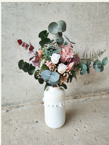
Jarrón grande: 84€

Si dispones de una mesa dulce, la puedes decorar con algún jarrón con las flores preservadas que prefieras, las iniciales de madera con flores son preciosas y dan un toque espectacular a cualquier rincón donde la pongas. Las guirnaldas pueden ser una muy buena opción para delimitar la mesa y adornarla de forma sutil pero bonita.