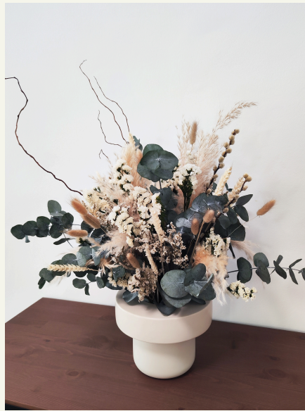
Centro grande: 130€