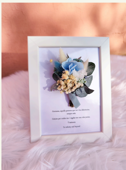
Marco con ramillete: 32€