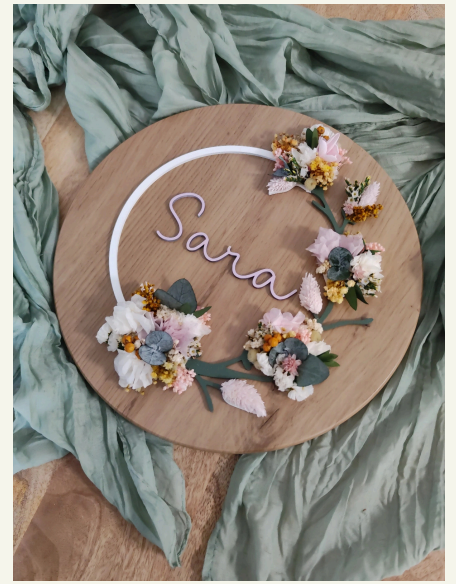
Coronas: consultar tamaños