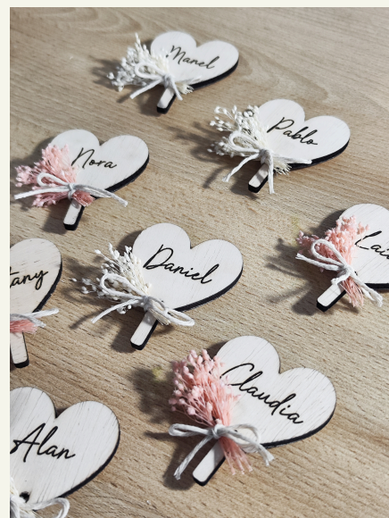
Marcasitos corazón: 2,85€/unidad