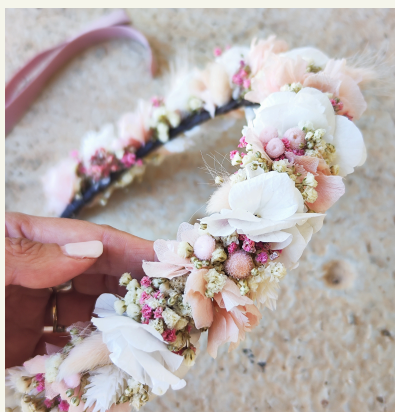
Coronas niña: 55€

Para hacerlas a medida, lo único que necesitaremos saber es el contorno de la cabeza en centímetros.