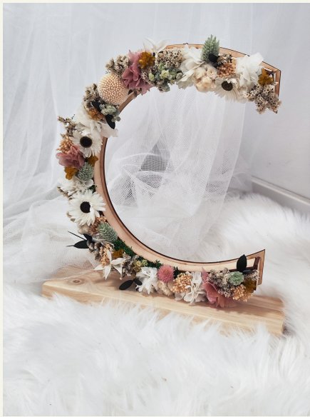
Letra de madera con flores: 55€