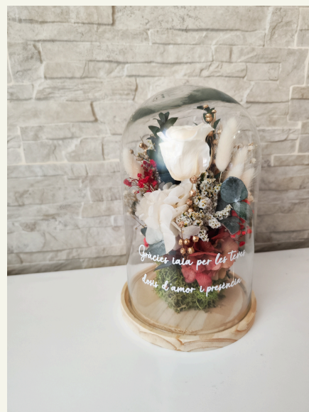
Cúpula grande con vinilo: 73€