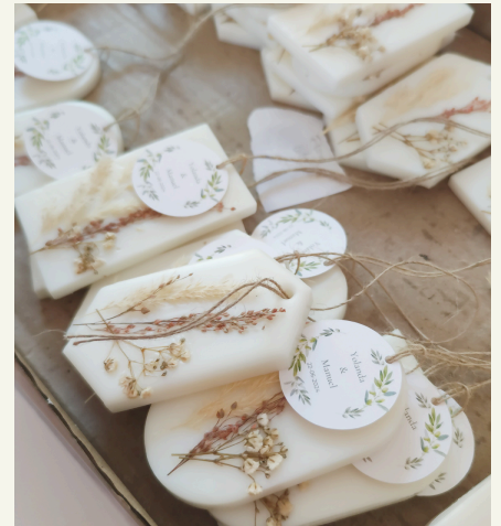
Decoraciones al gusto