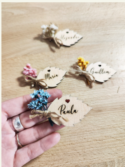
Marcasitos forma de hoja: 2,85€/unidad

Marcasitos de madera grabado a láser con imán en la parte trasera, en forma de corazón , lacito y ramillete de flores preservadas.