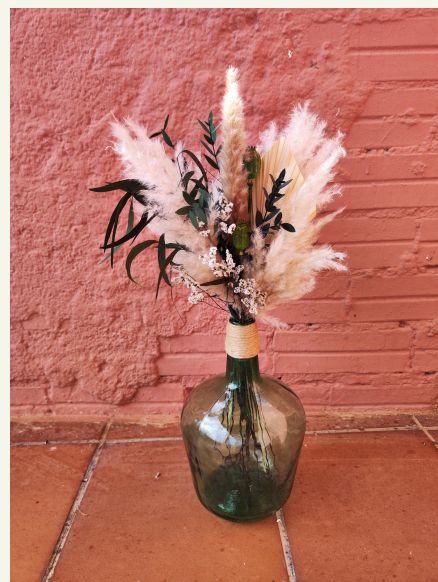
Damajuanas: consultar tamaños