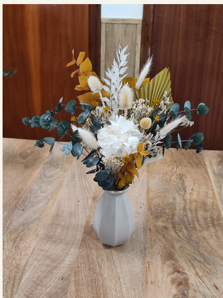
Jarrón pequeño: 45€