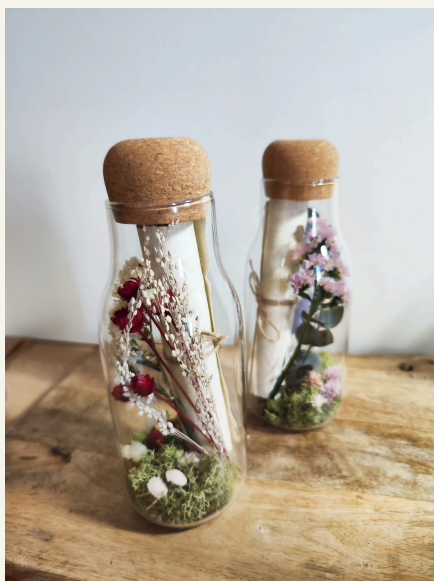
Botellas de cristal con mensaje: 24€

Si además tienes que hacer detalles a personas especiales, te proponemos varias opciones: