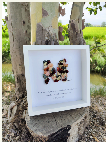
Cuadro con inicial y nombre: 55€

Sea cual sea la elección, lo importante es que los detalles reflejen tu agradecimiento y hagan que los invitados se lleven un recuerdo especial de la celebración.