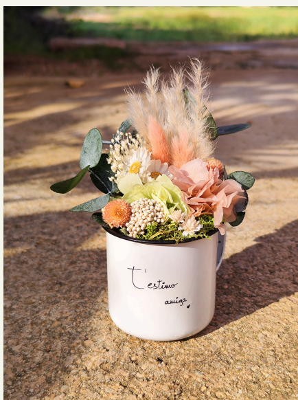
Taza con mensaje: 32€