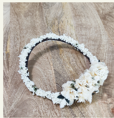
Corona reversible: 60€