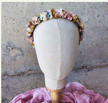
Diademas con hortensias y flores pequeñas: 53€