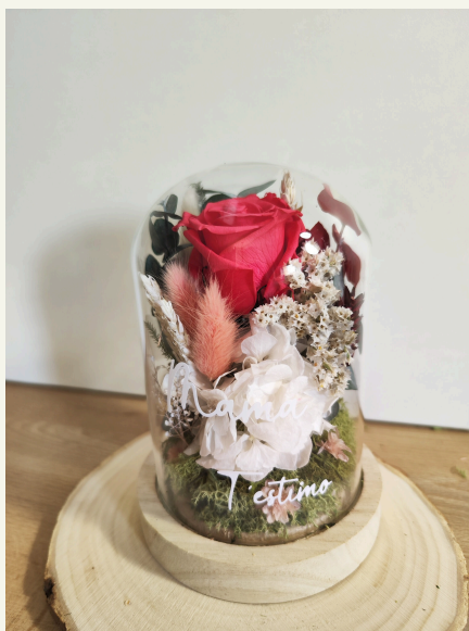
Cúpula pequeña con vinilo: 52€