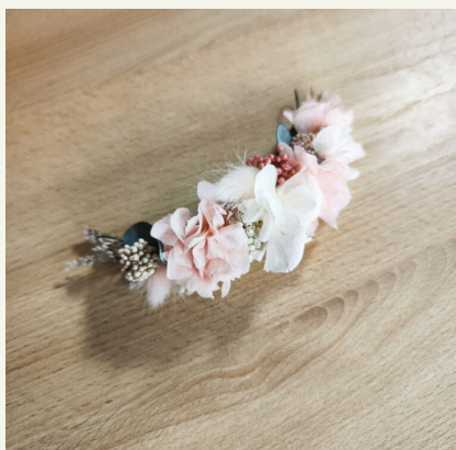
Tocados niña: 35€